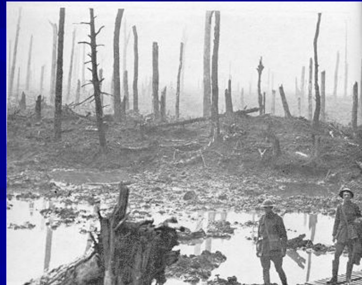
Desolación en el frente luego de la guerra